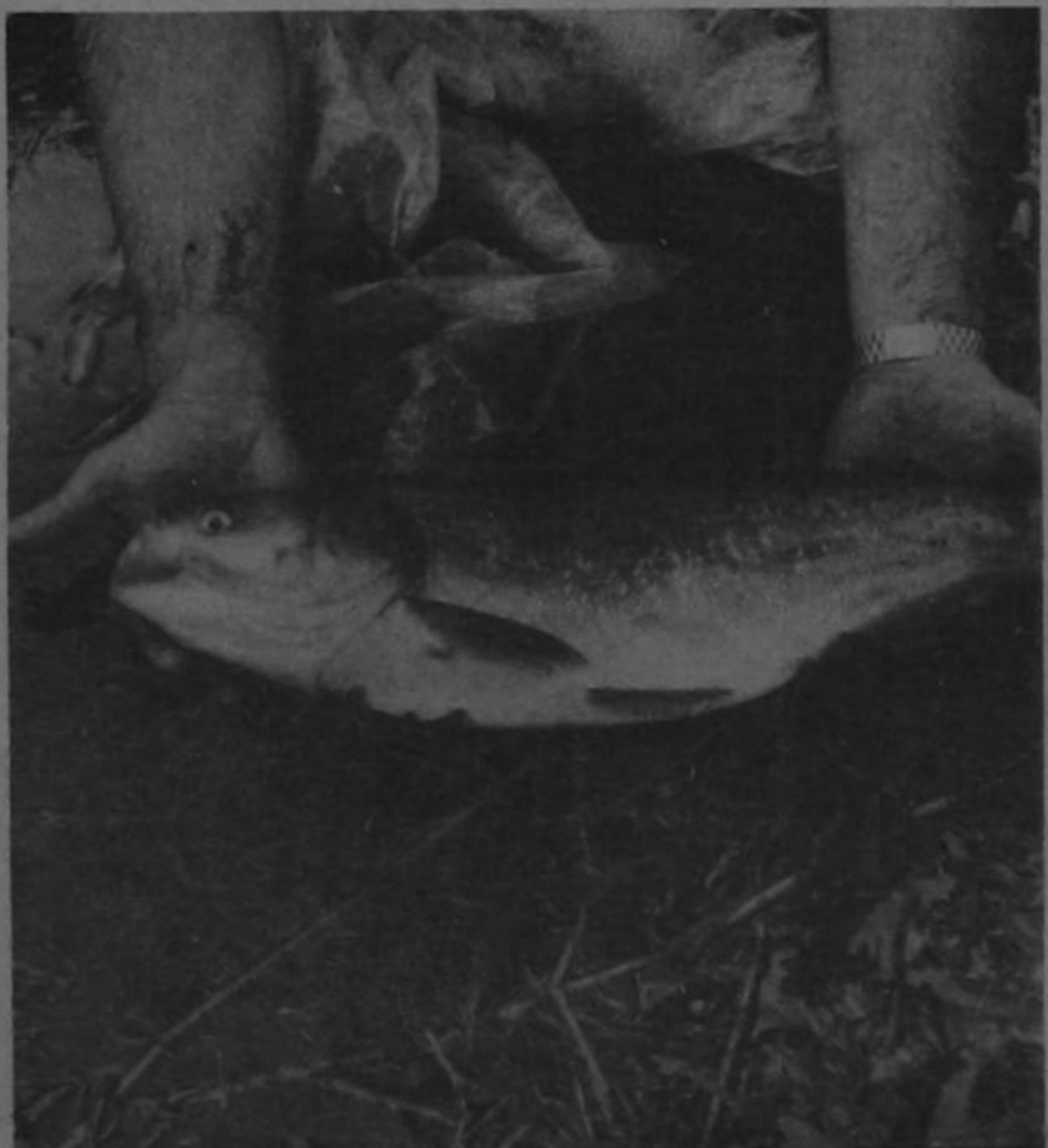
Carpa china, desde su llegada al país ha demostrado una excelente adaptabilidad, caracterizándose por su rápido crecimiento.

El pescado se puede ofrecer a un precio más reducido, y ofrece vitaminas ricas en yodo que son de tanto valor para el desarrollo del individuo.