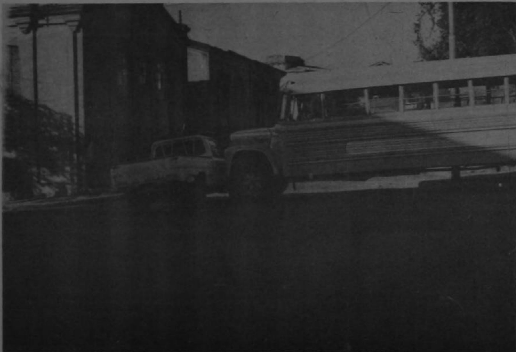
Este autobús, como todos los de las rutas que conducen a Guadalupe y Moravia, acostumbra bajar por la avenida séptima a exceso de velocidad. Resultado: un pick up prensado por el bus. El suceso se produjo 100 metros al norte de la Casa Presidencial.