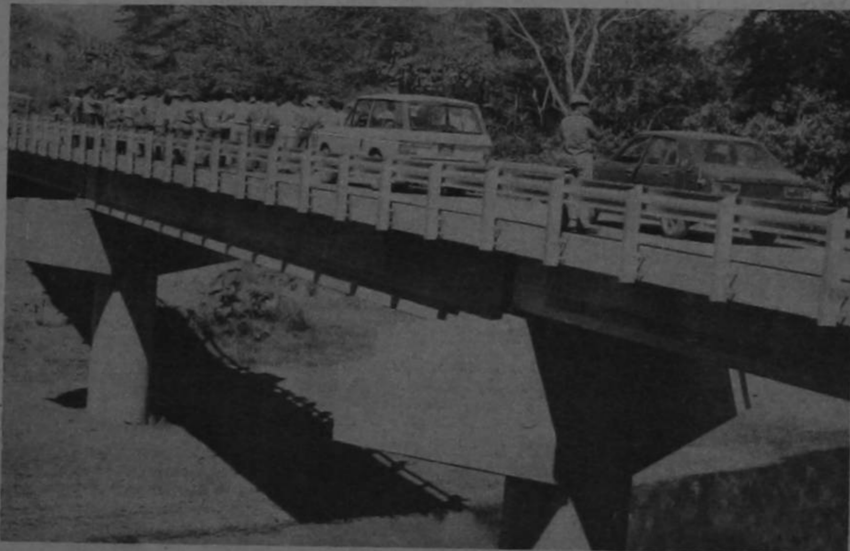
Bajo un tórrido sol, el presidente Daniel Oduber inaugura el puente sobre el río Juan de León. El magnífico puente lleva nuevas esperanzas a muchos agricultores del lugar.

"Los extremistas todo lo quieren hacer por la violencia y se equivocan de camino".