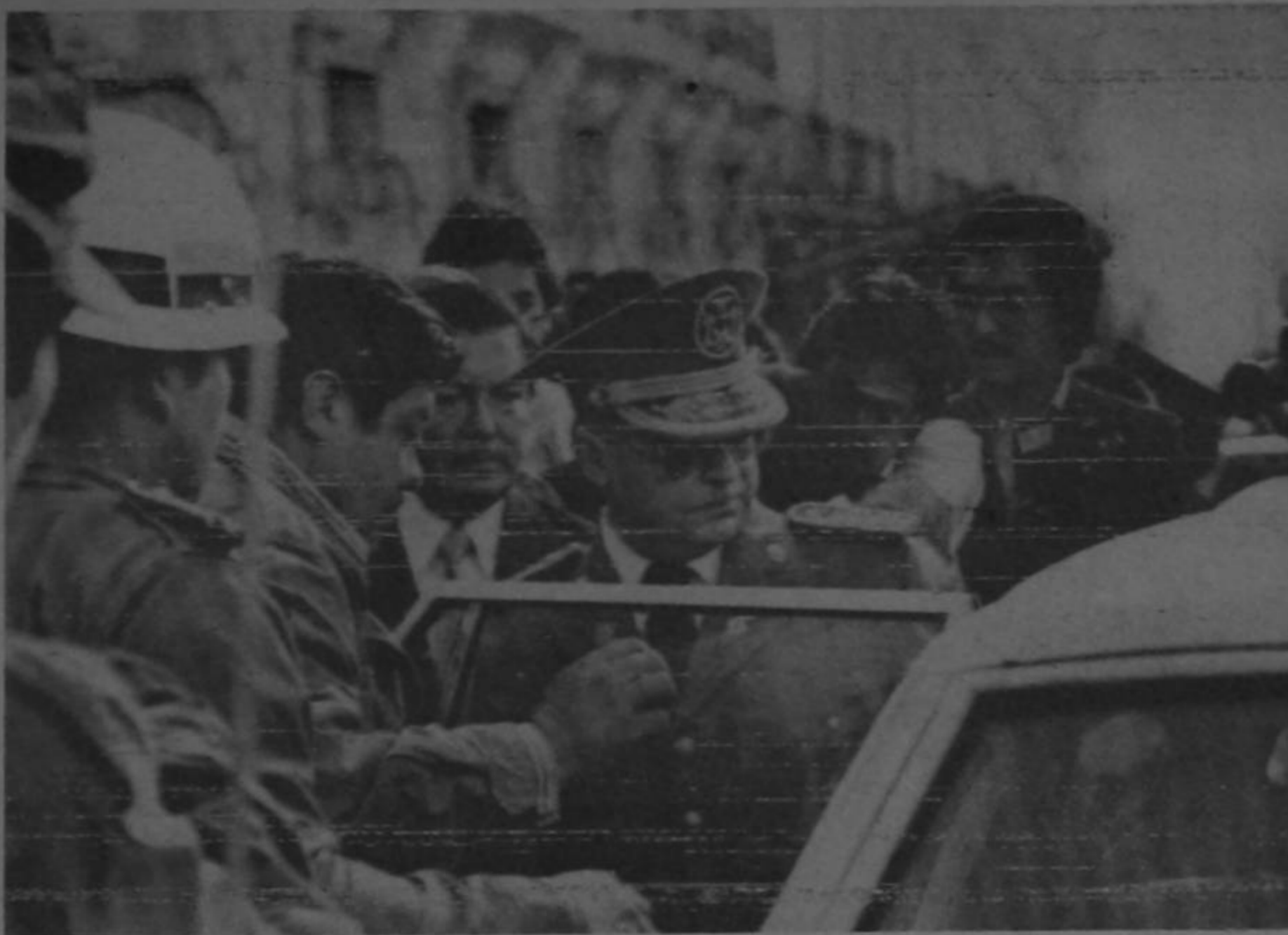
ADIOS.— El general Guillermo Rodríguez Lara sale del palacio presidencial en Quito, ayer, después de entregar al poder a una Junta de comandantes del Ejército, la Marina y la Fuerza Aérea.

El general Guillermo Rodríguez Lara, de 53 años, leyó una declaración (Pasa a la pág. 14)