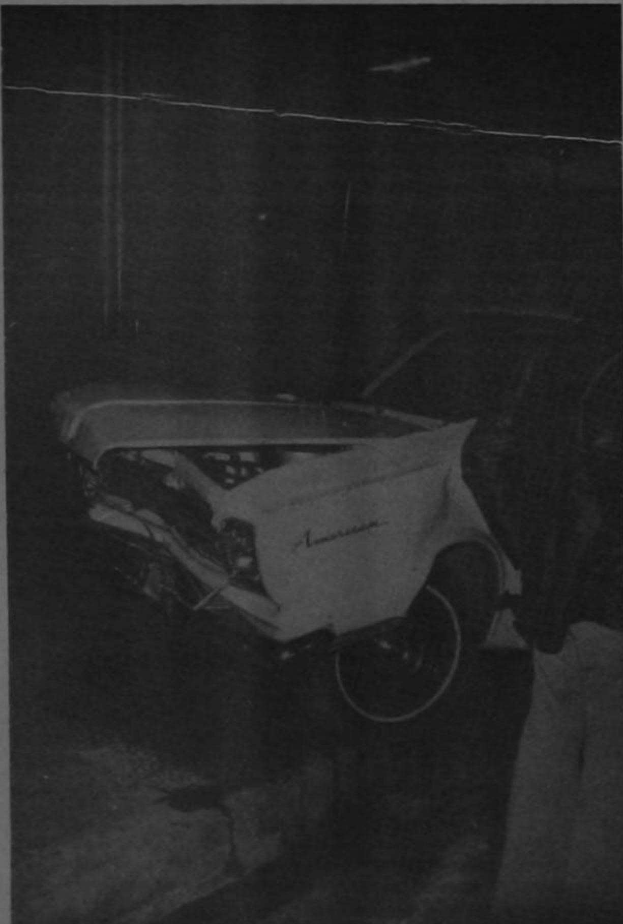
Este Rambler American colisionó en plena capital introduciéndose luego a la acera. El suceso se produjo en la esquina de la embajada americana, 100 metros al este de la iglesia del Carmen. El otro vehículo sufrió daños menores.