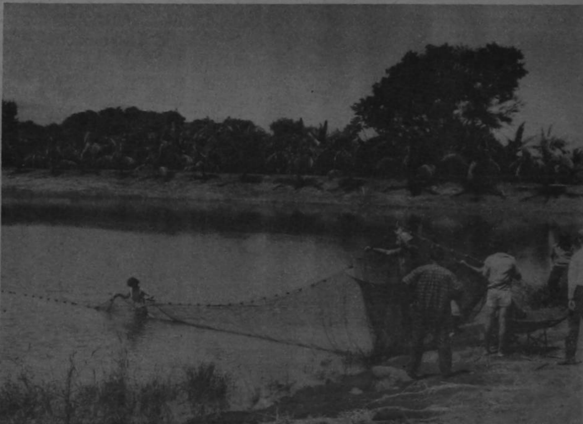
En la estación experimental Fabio Baudrit en La Garita de Alajuela, técnicos del MAG, mediante redes sacan de los estanques de crecimiento carpas chinas para su control periódico.