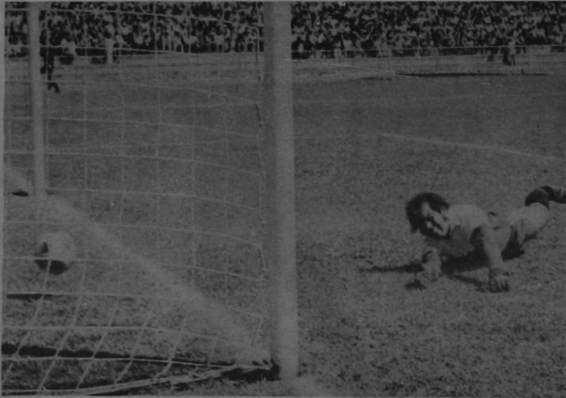
CASTRILLO VENCIDO: El arquero universitario tuvo que ir tres veces al fondo de su arco a sacar el balón. Este fue el tercer gol que le hicieron los porteños ayer en el preliminar del estadio capitalino. Un tiro libre rasante y en curva enviado por Marshall hizo que la pelota pasara entre un bosque de piernas. El tiro fue tan sorpresivo que la estirada del portero resultó inútil.