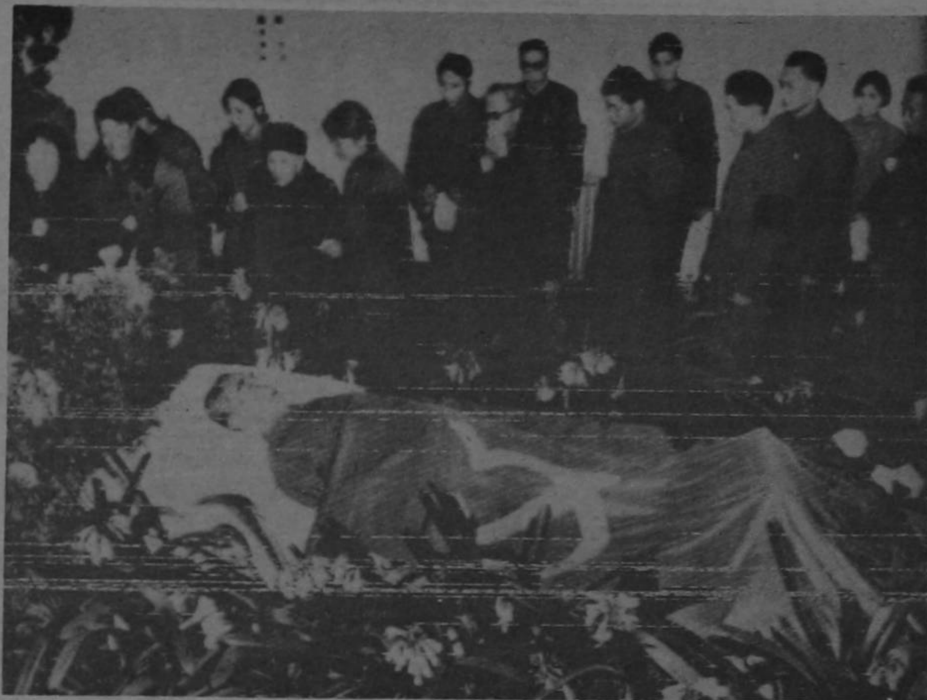
DESPIDEN A CHOU EN-LAI.- Los dolientes desfilan ante el cadáver del primer ministro Chou En-lai, envuelto en una bandera en el hospital de Pekín. Sus restos fueron incinerados después en el cementerio de Papaoshan para revolucionarios, según informó la agencia Hsinjua.