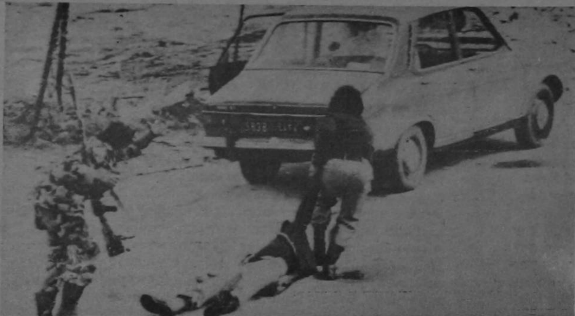
HERIDOS.- Miembro herido de la fuerza musulmana que forman palestinos y libaneses, es llevado a rastras a un vehículo después de un choque con el ejército, en el cual la fuerza izquierdista trató de romper el bloqueo de cristianos derechistas a un campamento de refugiados en los suburbios de Beirut.