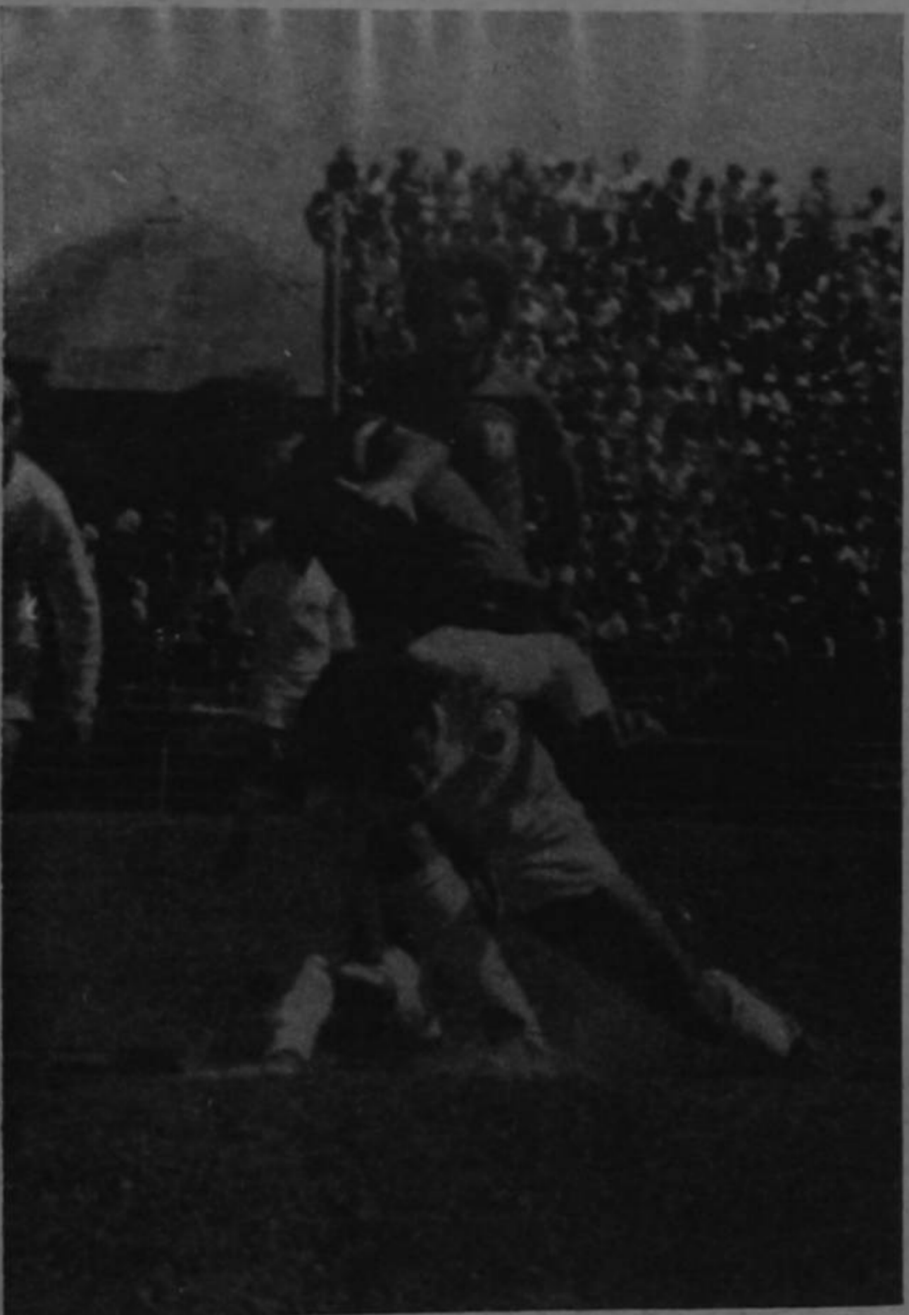
SE JUGO CON CORAJE: Manudos y brumosos lucharon tras la victoria dándose por entero. Fue un partido más de fibra que de tecnicismo. Aquí vemos a Estupiñán deteniendo en jugada fuerte al volante Solera.