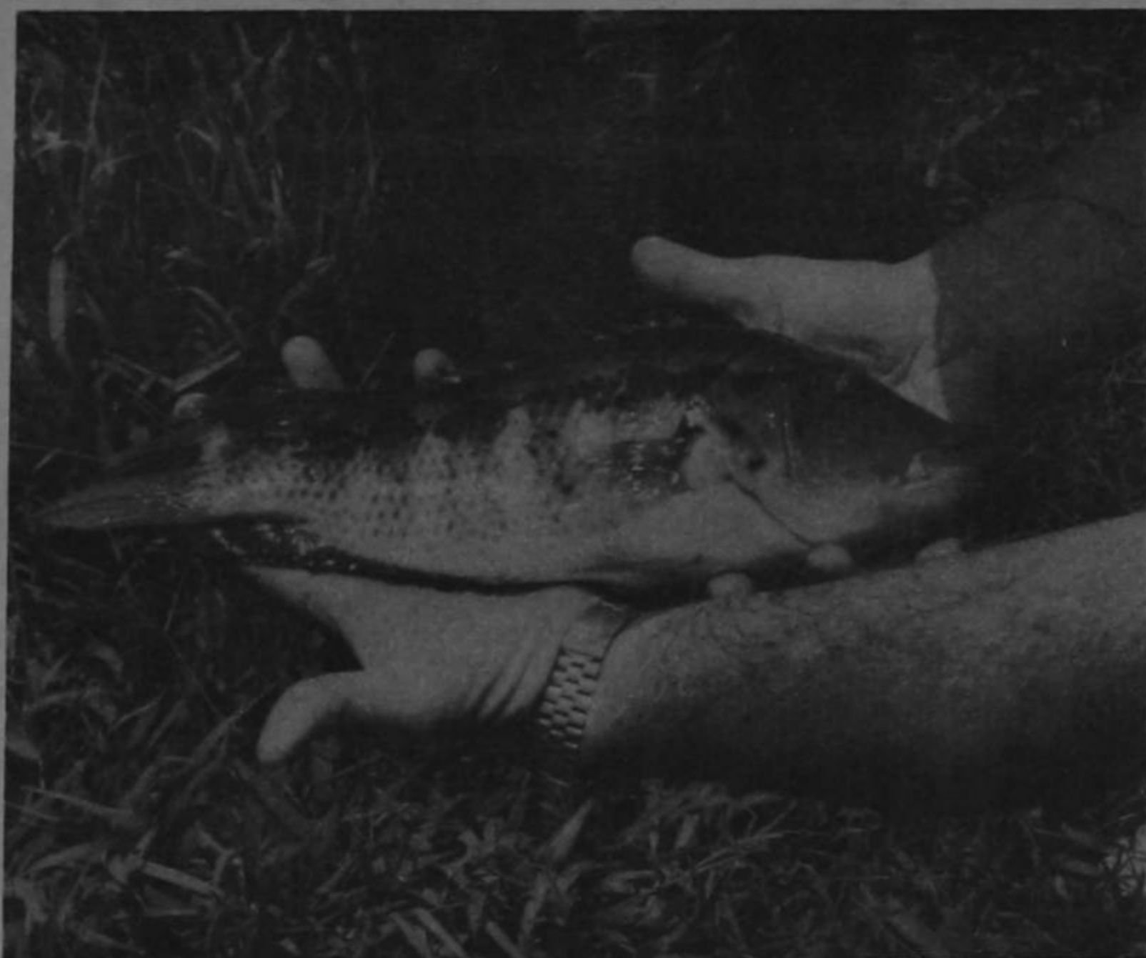
El guapote, especie típica de nuestro país, poco explotada hasta ahora.